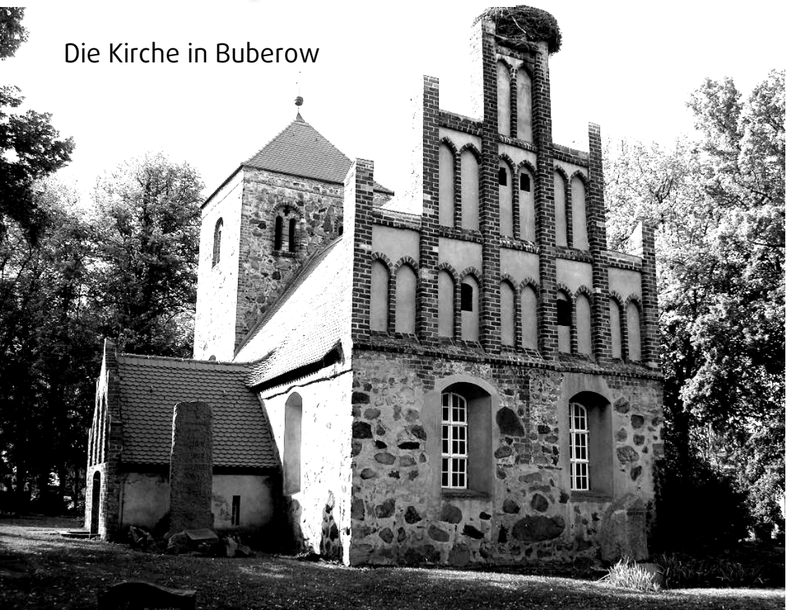
Die Kirche in Buberow